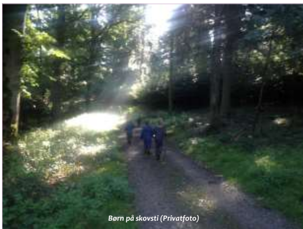
Børn på skovsti (Privatfoto)

Jeg bliver glad, når jeg er i naturen. Det tror jeg ikke, jeg er ene om – jeg tror det er sådan for de fleste mennesker. Nogle gange er det en vild, sprudlende og meget bevidst glæde. Andre gange er det mere som en underliggende lykkefølelse, som jeg først bliver bevidst om, når jeg virkelig mærker efter.