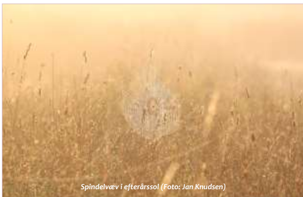
Spindelvæv i efterårsol